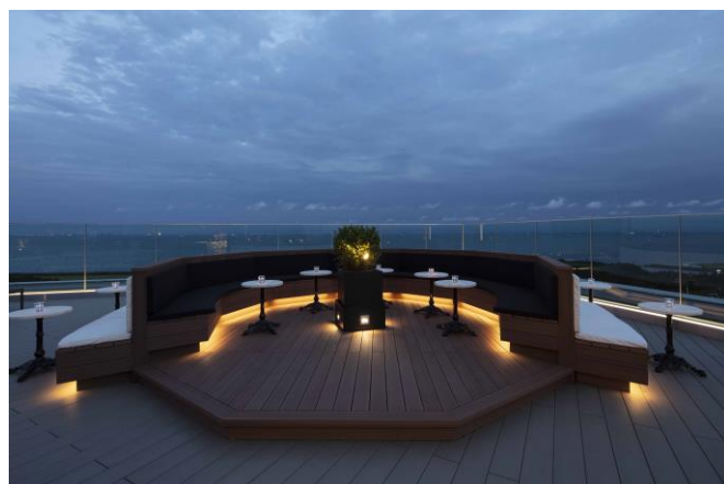
東京湾を見晴らす絶景が自慢の「ルーフトップバー」(屋上)