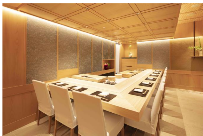
檜一枚板で設えたカウンターが印象的な「すし 絵馬」(1階)