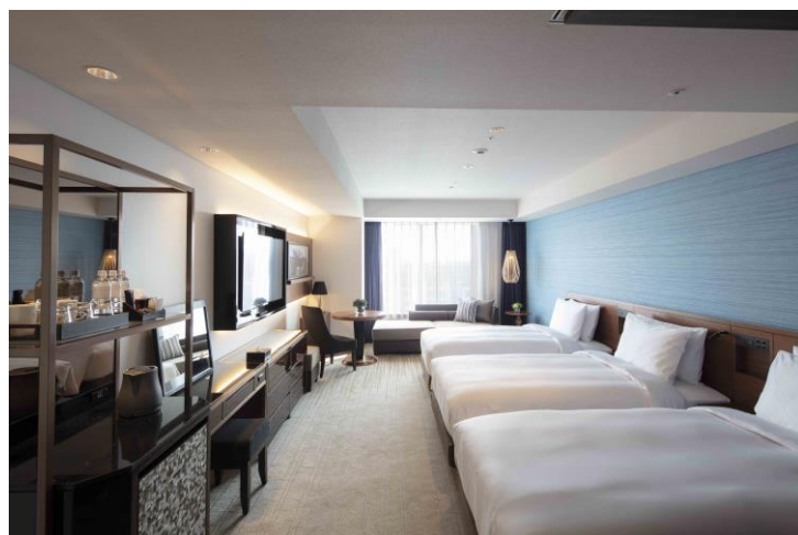
ソファベッド利用で4名様まで滞在が可能なファミリー ルーム