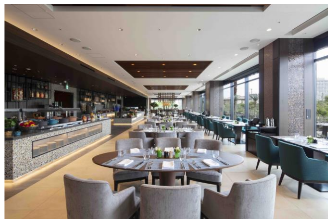
24時間温かいお食事ができる「ギャラリーキッチン」(1階)

天気の良い日にはテラス席で、公園の緑を眺めながら海風を感じる優雅なひとときをお過ごしください。