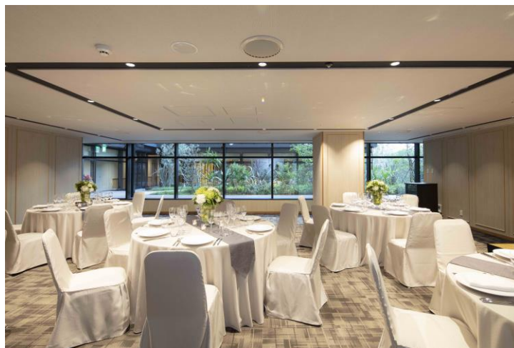
ファンクションルーム (2階)