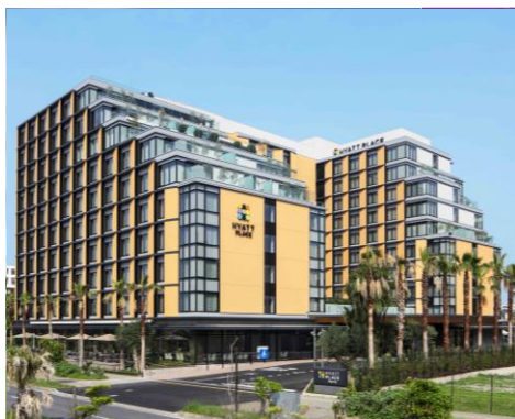
ハイアット プレイス 東京ベイ