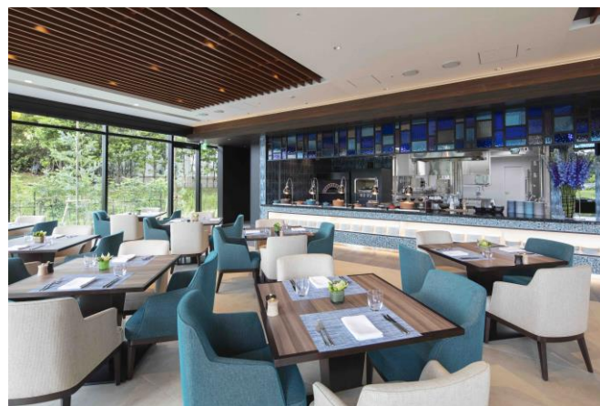
本格的なピザ窯やグリルオーブンを自慢